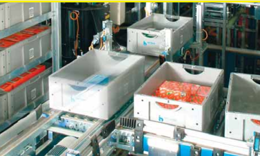
Fördertechnik vor AKL