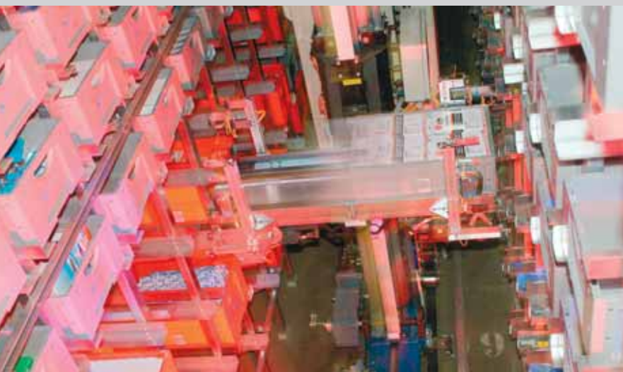
Behälterentnahme im AKL