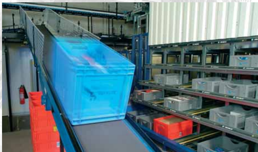
Behältertransport zur Kommissionierung